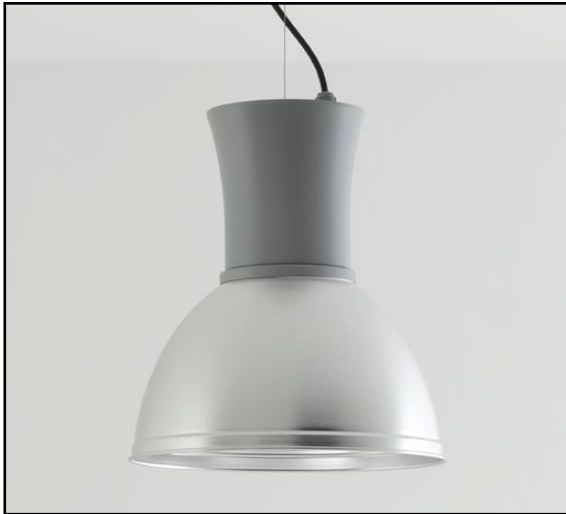
Foto e fotometria con ottica cod. 2005

Apparecchio a sospensione con corpo tornito verniciato a polvere epossipoliestere resistente ai raggi UV oppure anodizzato. Equipaggiato con power led ad alta efficienza da 32W con flusso luminoso tipico di 3860lm. L'apparecchio è fornito di driver da 900mA, completo di cavo di sospensione in acciaio zincato da 1,2mm, cavo elettrico tripolare 3x1mm da 200cm e rosone in lamiera di acciaio verniciato. Il grado di protezione contro la penetrazione di polvere, corpi solidi e liquidi è IP40. Ottiche escluse da ordinare separatamente.