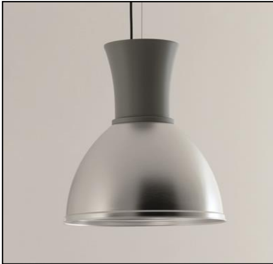
Immagine con ottica cod. 2003

Apparecchio a sospensione con corpo tornito verniciato a polvere epossipoliestere resistente ai raggi UV oppure anodizzato. Equipaggiato con power led ad alta efficienza, l'apparecchio è fornito di driver da 1050mA, completo di cavo di sospensione in acciaio zincato da 1,2mm, cavo elettrico tripolare 3x1mm da 200cm e rosone in lamiera di acciaio verniciato. Il grado di protezione contro la penetrazione di polvere, corpi solidi e liquidi è IP40. Ottiche escluse da ordinare separatamente.