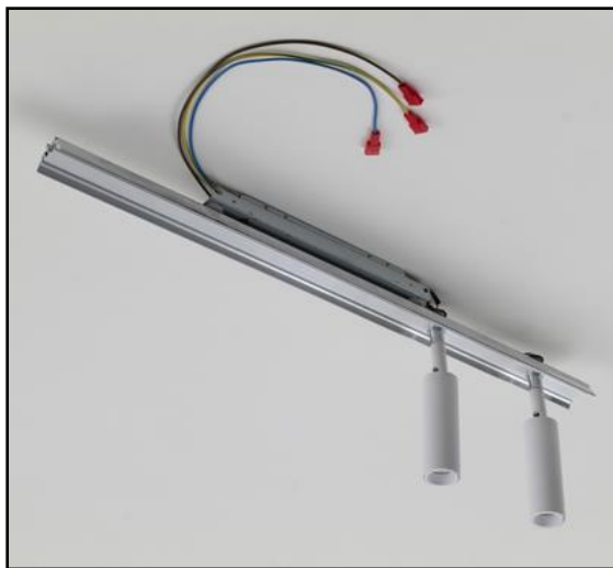
Attenzione: l'immagine raffigura il modulo con spot LEO MINI

Modulo LED ad alta efficienza, realizzato in alluminio estruso, completo di driver, parabole metallizzate da 50°, cablaggio e dispositivi per la connessione elettrica. Il grado di protezione contro la penetrazione di polvere, corpi solidi e liquidi è IP20. Articolo da completare con i profili Liberty e relativi accessori.